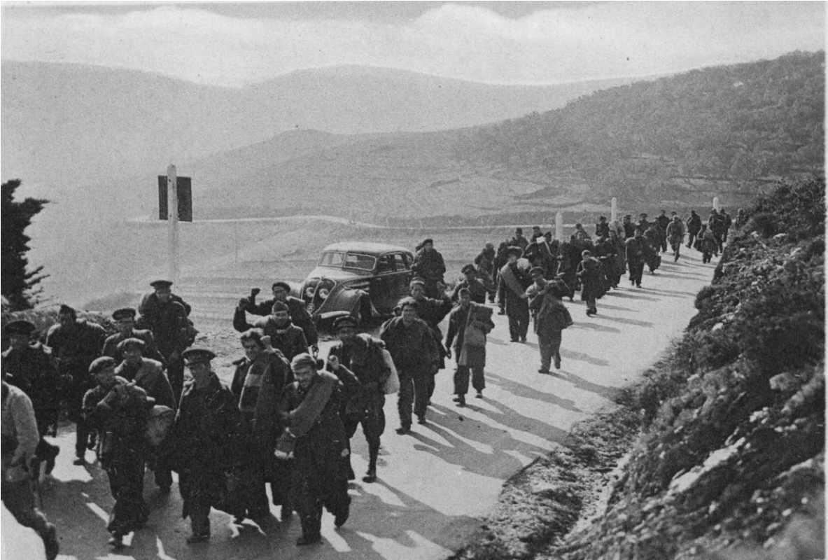
Banyuls (Rosselló), milicians que es dirigeixen a Argelers.